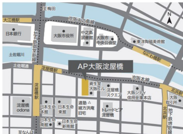
地下連絡通路ご案内図